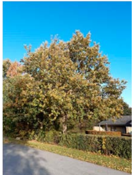
Grundlovstræerne i Kr. Eskilstrup og Ugerløse tv. - i Kvarmløse og St. Merløse ovenfor.