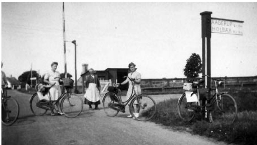
Cyklister ved trinbrættet i Skimmede med banevogtersken midt i billedet. I baggrunden det lille venterum med bænke. Udateret.