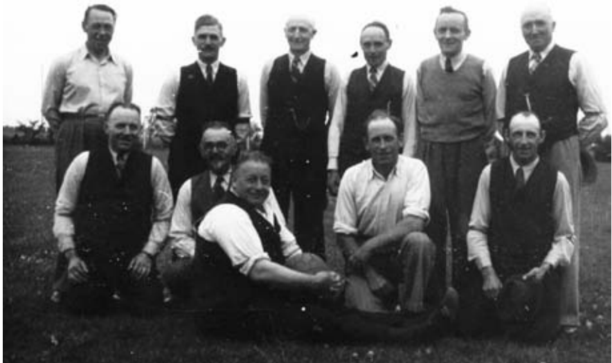
Sognerådets fodboldhold ved showkamp mod Tølløse Handelsstandsforening 1942-43.