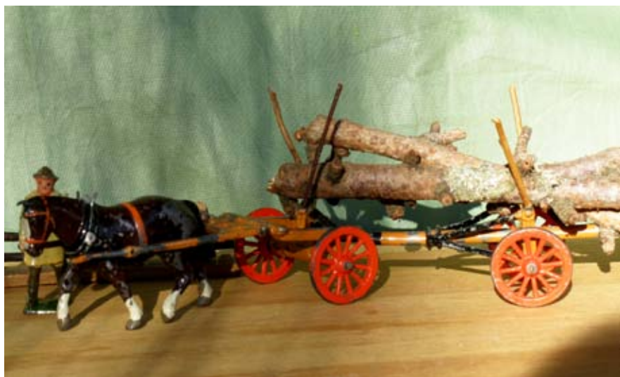
Også bybørn skulle lære om skovens arbejde - legetøj fra 1920'erne.

at forny sig. Egetræer har en om-drift på 150 år, før de er tjenlige til skibstømmer, og da englænderne havde taget den danske flåde i 1807, var der ikke tilstrækkeligt egetømmer i kronens skove til at bygge nye krigsskibe. Krigen mod englænderne måtte derfor af nød føres med små kanonbåde. Det blev til Kanonbådskrigen, en slags kongeligt autoriseret pirateri. Kronens skovridere fik ordre til at plante ny egeskov, de såkaldte flådeegge. Så sent som i halvfemserne morede Dyrehavens skovrider sig med at sende besked om, at nu var flådeegene tjenlige til bygning af en ny flåde. Det skabte en del morskab hos Søværnet, som på de sidste rester af Lindøværfet