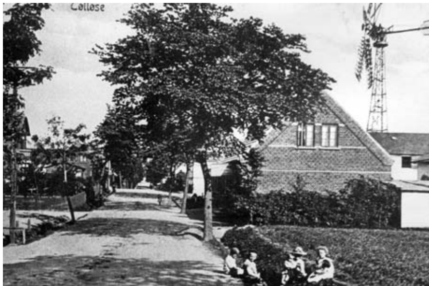
Tølløsevej set mod øst med møllen på Møllevej t.h. Billedet er taget inden hovedbygningen ud mod vejen blev opført.

Hvordan kom Mosten til at ligge nærmest midt i byen? Da Mosten blev oprettet, lå den afgjort i byens udkant. Vestergade fandtes ikke endnu, og der var kornmark der, hvor vi nu har supermarkederne. Men der synes at have været en sti, der førte fra Aastrup til Tøllø-