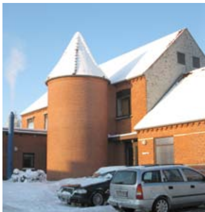
Trappetårnet ved hovedbygningen.