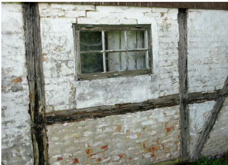
Fattigt bindingsværk.

mark blev bindingsværk. 5 Når man nu taler om 'fattigt sjællandsk bindingsværk', skyldes det simpelthen mangel på ordentligt tømmer. Til opførelse af slotte, palæer og store købmanshuse indførte man pommersk fyr. Norge stod for levering af bl.a. skibsmaster.