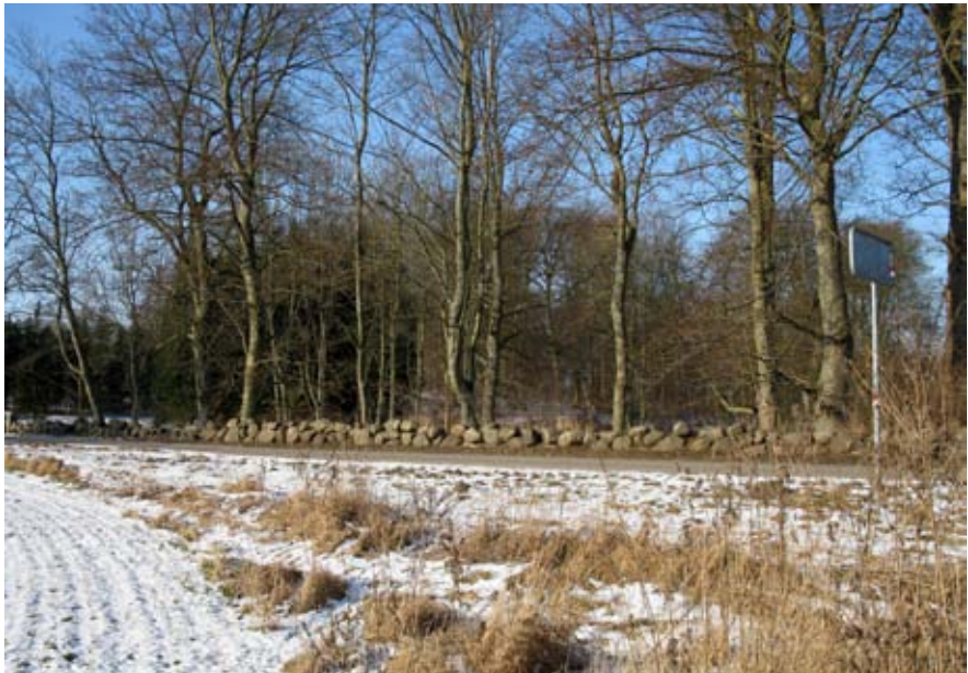
Stendige ved Aastrup. Foto: Marina Wijngaard, 2012.

I slutningen af 1700-tallet var kun ca. 3% af Danmarks areal skovdækket. I 1806 beskrives en skov i Ramsø herred: 'de faa tilovers-