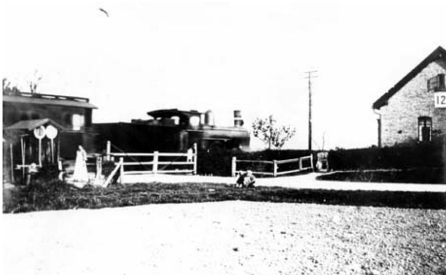
Jernbaneoverskæringen i Skimmede med banehus nr. 12 til h. Datering: 1911.